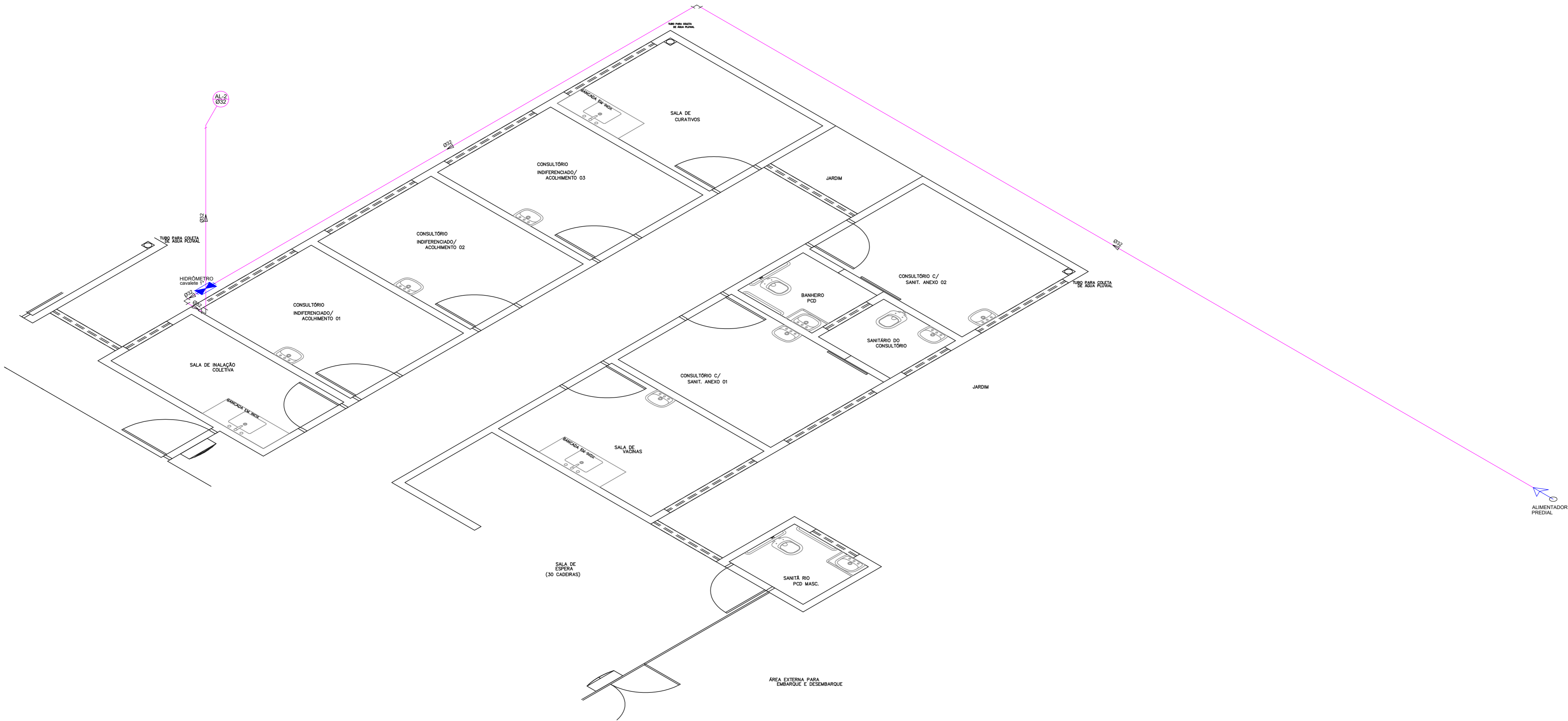
Detalhe H9 escala 1:50